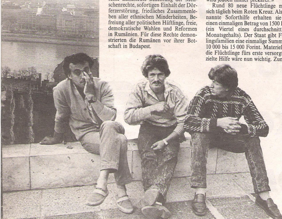
Die rumänischstämmigen Flüchtlinge hoffen auf ein freies Leben im Westen.

spiel für Weiterbildung, für den Kauf von Häusern oder Wohnungsinventarwerkzeuge.