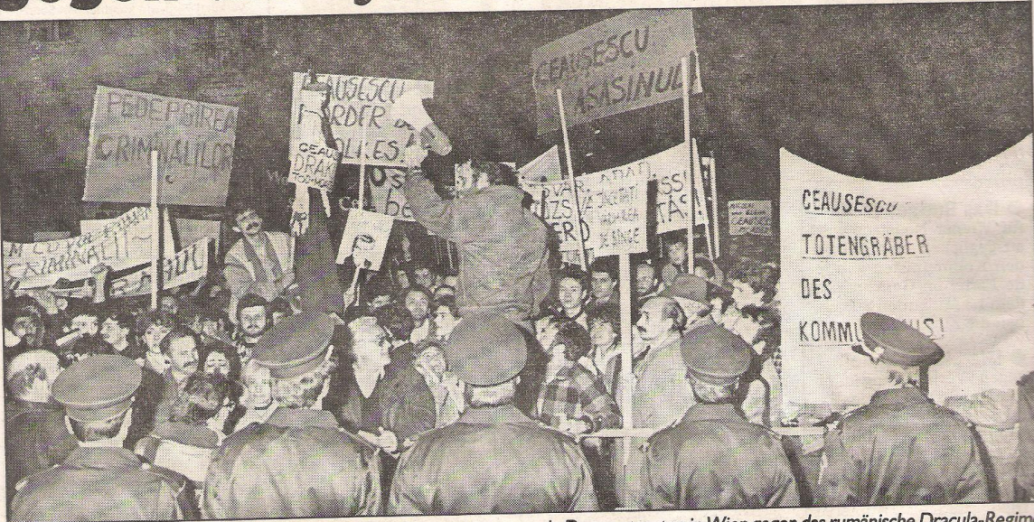
Mit Transparenten und Sprechchören protestierten Donnerstag tausende Demonstranten in Wien gegen das rumänische Dracula-Regime