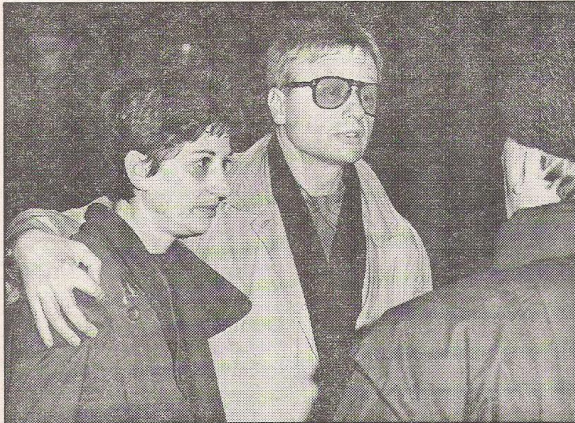
▲ Burgschauspieler Franz Morak, seine Frau und zahlreiche österreichische Schauspieler und Künstler schlossen sich dem Protest an. Sie stellten Donnerstagabend vor der rumänischen Botschaft brennende Kerzen und Grablichter ab. ▶