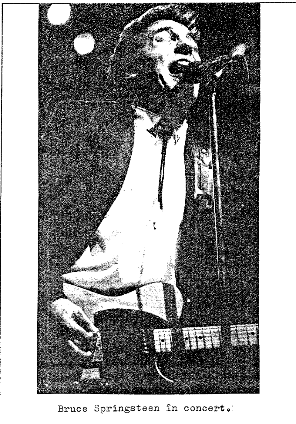
Bruce Springsteen în concert.

Incet se lasă întunericul. Hotărîm să coborîm la peluză cu pancardele și steagurile. După zece minute de așteptare, oamenii din forțele de ordine, ne dau voie să pătrundem în peluză. Formăm o linie de steaguri și pancarde: în frunte un steag românesc, apoi pancardele și, la urmă, un alt steag românesc. Pe pancarda era scris în limba engleză: GRUPAREA ROMANIA LIBERĂ, PENTRU RESPECTAREA DREPTURILOR OMULUI IN ROMANIA, PENTRU ALEGERI LIBERE SI REFORME DEMOCRATICE IN ROMANIA, TRAIASCA PRIETENIA ROMANO-MAGHIARA, NU DISTRUGETI SATELE-NU DISTRUGETI ISTORIA. In această formație ne îndreptăm spre tribuna oficială, făcîndu-ne loc prin mulțime. După primii pași, spectatorii se ridică în picioare, încep să curgă aplauze; auzim BRAVO ROMANIA, BRAVO. Ne oprim în fața tribunei oficiale, timp în care vin la noi mai multe persoane de diverse naționalități: maghiari, polonezi, cehi, est germani să discute și să-și exprime simpatia și solidaritatea cu noi. Continuăm să mergem încet pînă ajungem în dreapta scenei și apoi traversăm din nou stadionul cu foarte mare greutate din cauza mulțimii. Aceleași aclamații: BRAVO ROMANIA! SINTEM ALATURI DE VOI!. Ajungînd aproape de ieșire, înaintarea ne este blocată de tirul de blițuri, de camerele video.