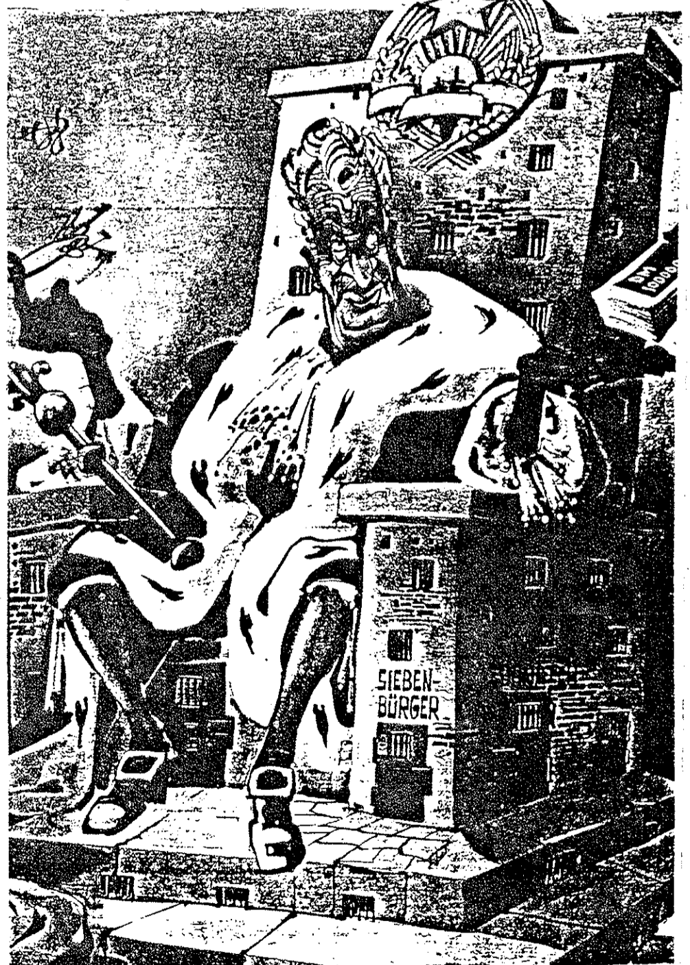
Der König von Rumänien